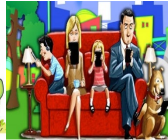
İletişimi olmayan aile