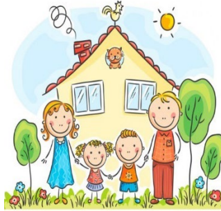
İdeal, mutlu aile

Televizyon ve bilgisayar (internet) yoluyla çocuklar, paylaşma, iş birliği ve davranış modellerini algılama gibi olumlu sosyal davranış boyutlarının geliştirilmesine yönelik mesajlar alabildikleri gibi, zararlı mesajları da kolayca alabilmektedirler. Aşırı televizyon izlemenin ve bilgisayar oynamanın çocuklarda, saldırganlık, şiddet içeren davranışlar ve çocukluk obesitesi gibi bazı psikosomatik sorunlara neden olduğu ve ders başarısını düşürdüğü belirlenmiştir. Amerikan pediatri akademisi çocukların televizyon izleme süresini günde 1-2 saatle sınırlamalarını önermektedir.